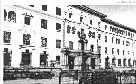
PODER JUDICIAL. Debe resolver pedido de Corpac