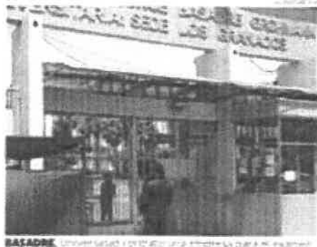
BASADRE. UNIVERSIDAD DE EDUCACIÓN Y CULTURA.

ESTUDIOS. Antes de la pandemia más de tres mil se inscribieron como postulantes a la casa de estudios. La mitad desistió