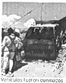
Vehículos fueron quemados