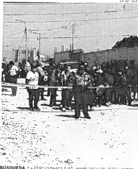
BUSQUEDA. La PNP va busca a los implicados de este crimen